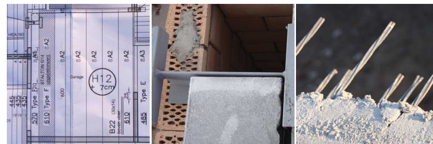
Detail van legplan

Verdunde uiteinden en opengemaakte kanalen zijn verkrijgbaar op aanvraag.